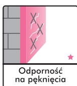
Odporność na pęknięcia